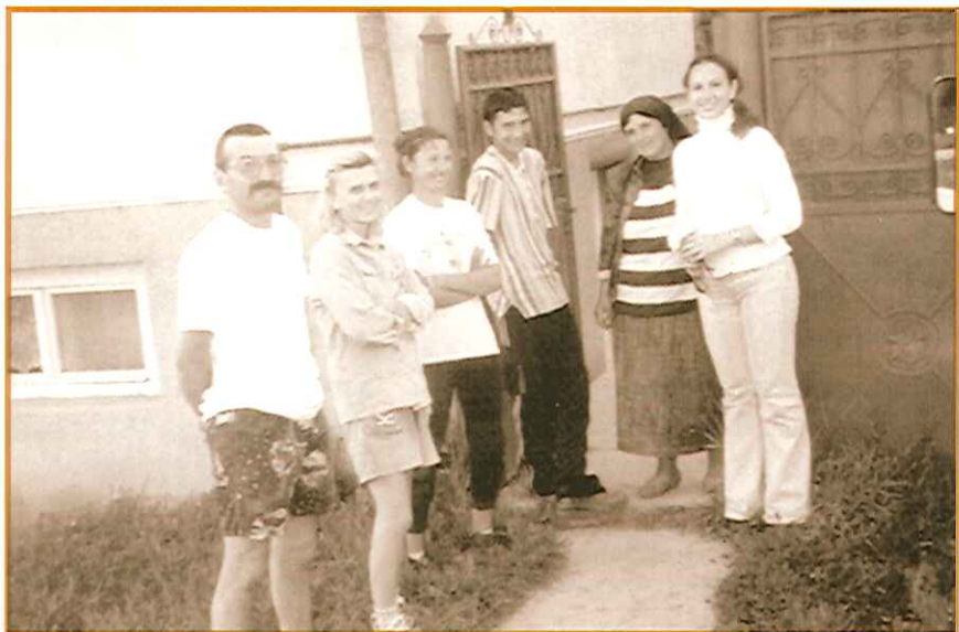
Encuentro transnacional en Cluj - Napoca (Rumania).