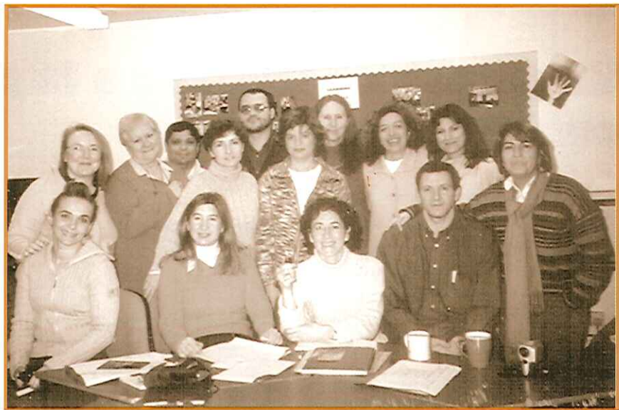
Equipo de socios del proyecto en Oxford (Reino Unido).

Al mismo tiempo hemos tenido la oportunidad de dar a conocer el valioso trabajo que desarrollamos las entidades del ámbito de la educación no formal, sobre todo en lo que se refiere a la creación de un curriculum formativo integrado e intercultural y en la incorporación de los profesionales de la mediación en los equipos educativos. ■