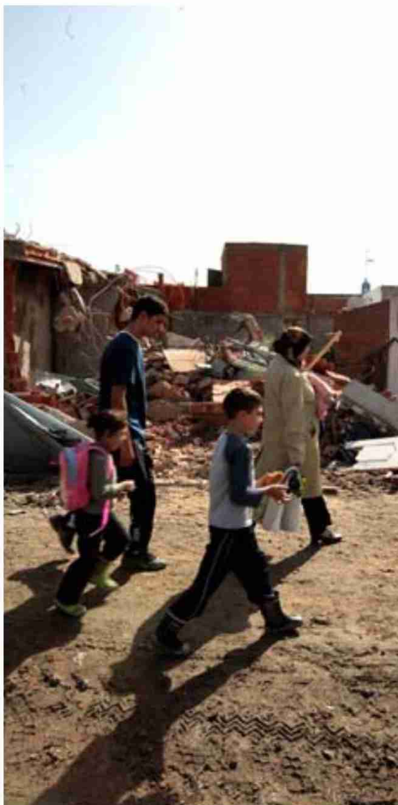
Una familia pasa frente a un derribo en la senda. s. ch.

La respuesta a la “ocupación” será la misma que cuando ha desmantelado otros núcleos chabolistas. Es decir, derribo y realojo si procede. “Deberán cumplir las condiciones para tener acceso a una vivienda pública de realojo. Esto es, carecer de los recursos económicos suficientes para