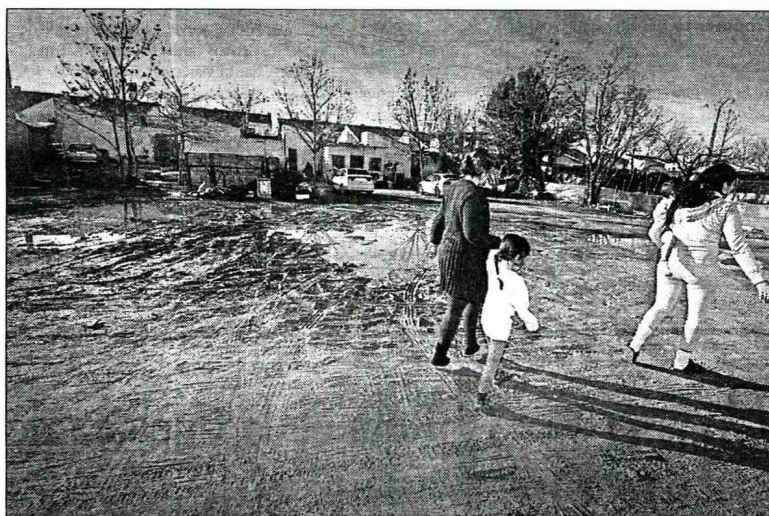
Madres paseando de la mano con sus hijos en medio de las calles sin asfaltar

La Fundación del Secretariado Gitano, Cáritas Interparroquial y Cruz Roja, tres de los colectivos que trabajan de forma más estrecha con los vecinos que habitan este barrio, la mayoría de etnia gitana, piden a las autoridades políticas que propongan, asuman y cumplan los compromisos adquiridos, “porque sólo con la unión del trabajo de todos y con la ayuda de las instituciones locales es posible avan-