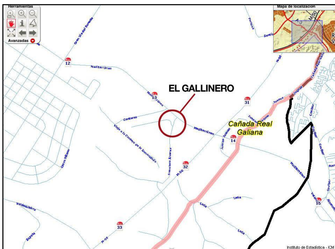
Mapa 7: Ubicación del núcleo chabolista “El Gallinero”, Calle Francisco Álvarez nº 2

Tras 20 años de convivencia, los romaníes siguen siendo los que en mayor medida sufren el rechazo y la discriminación de manera generalizada y múltiple, por su etnia gitana y la condición de inmigrante, creando incluso mayor recelo entre sus compatriotas rumanos y la población gitana española. Las precarias condiciones de los asentamientos han influido en la mala imagen del colectivo, sin embargo, los medios han jugado un papel central en la distribución de esta imagen negativa del colectivo. De hecho, en estos últimos años, los medios de comunicación nacionales han cubierto diariamente noticias que resaltaban el conflicto social generado por la aparición de los campamentos y la mendicidad asociada a estos. En definitiva, un tratamiento negativo de la realidad del colectivo gitano rumano que ha contribuido a la actual alarma social y mediática.