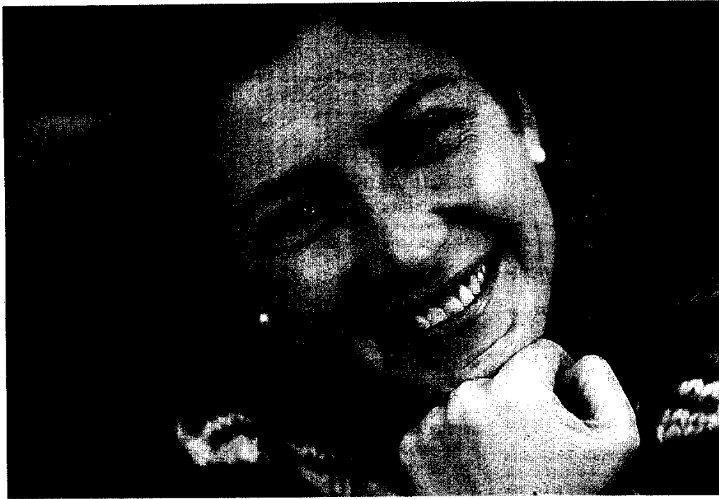
CONTENTA. La joven triunfadora con su gesto favorito, la sonrisa.