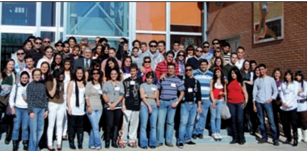
ENCUENTRO ESTATAL DE ESTUDIANTES GITANAS Y GITANOS (MADRID, MARZO 09)

El derecho que toda persona tiene a la educación es uno de los contemplados en la Declaración Universal de los Derechos Humanos, que fija como objeto el pleno desarrollo de la personalidad humana y el fortalecimiento del respeto a los derechos humanos y a las libertades fundamentales. Además, debe favorecer la comprensión, la tolerancia y la amistad entre todas las naciones y todos los grupos étnicos o religiosos, y promover el desarrollo de las actividades de las Naciones Unidas para el mantenimiento de la paz.