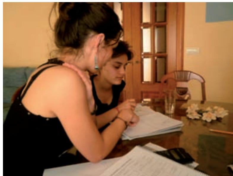
SEGUIMIENTO SOCIOEDUCATIVO EN GRANADA