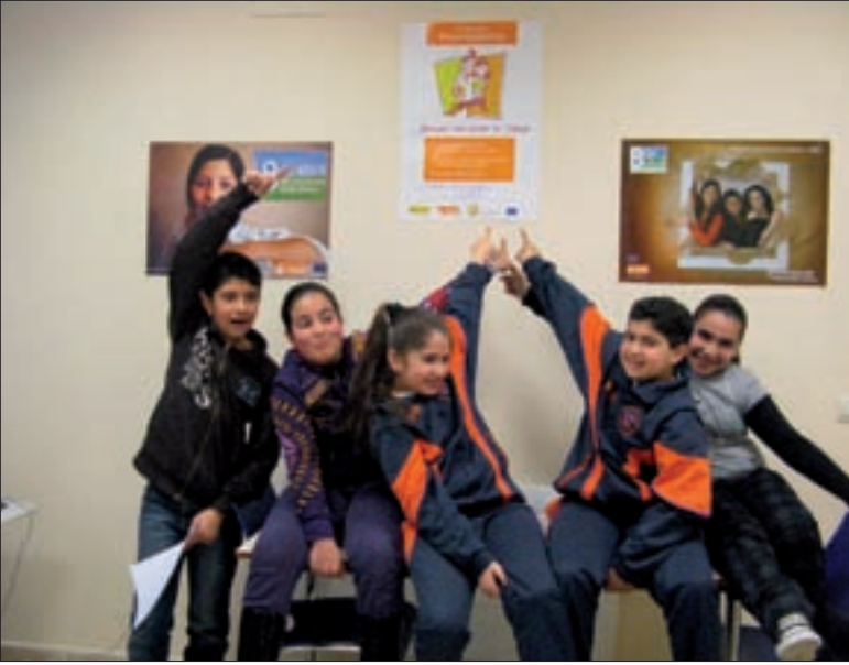
EN EL AULA PROMOCIONA DE SALAMANCA