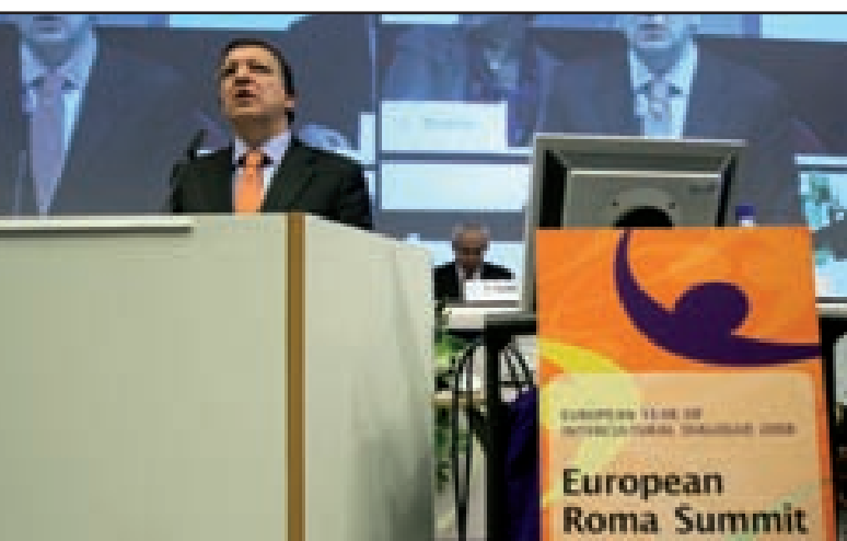
JOSÉ MANUEL DURÃO BARROSO, PRESIDENTE DE LA COMISIÓN EUROPEA DURANTE SU INTERVENCIÓN EN EU ROMA SUMMIT.

En este año se presentó el VI Informe de la Fundación FOESSA sobre exclusión y desarrollo social en España . En él, por primera vez, se aportan datos desagregados sobre la población gitana, aportando conclusiones muy significativas al constatar su sobrerrepresentación en el espacio de la exclusión severa donde el 12% de las personas en esta situación serían gitanas. Una de cada cuatro familias está afectada por situaciones de exclusión y un tercio de las familias padecen situaciones de “exclusión severa”. Según el Informe, hoy en España pertenecer a la comunidad gitana es “el factor más intensamente