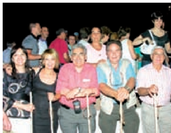
LA FSG PARTICIPÓ EN EL DÍA DEDICADO A LA COMUNIDAD GITANA EN LA EXPO08 CELEBRADA EN ZARAGOZA.