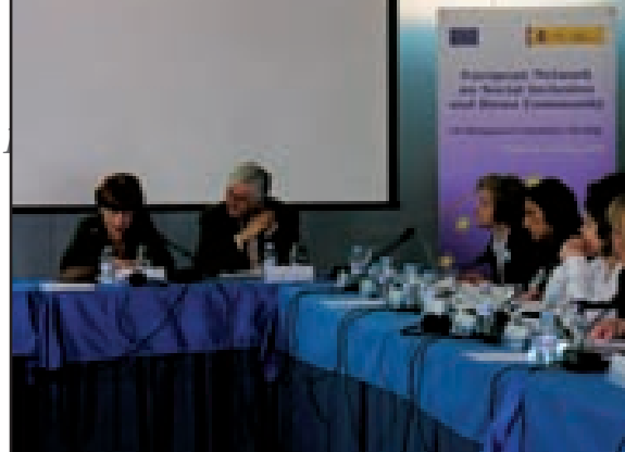
SESIÓN DE TRABAJO DEL COMITÉ DE PILOTAJE DE LA RED EUROMA EN SEVILLA.