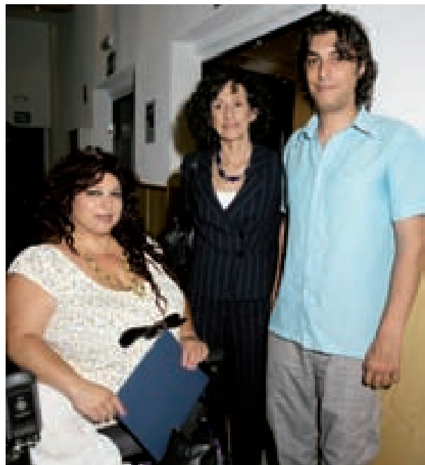
LA MINISTRA, MERCEDES CABRERA, JUNTO A LOS PARTICIPANTES EN EL ESTUDIO "LA SITUACIÓN DE MULTIDISCRIMINACIÓN ANTE EL EMPLEO DE PERSONAS GITANAS CON DISCAPACIDAD".

Son movimientos y propuestas esperanzadoras, aunque tímidas aún dada la dimensión del drama en el que viven tantas familias gitanas, pero puede que 2008 sea un año de inflexión para la cuestión gitana , en el que