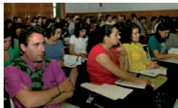
ENCUENTRO ANUAL DE RESPONSABLES TERRITORIALES CELEBRADO EN ÁVILA.

En 2008 la FSG ha apostado por la estabilidad laboral