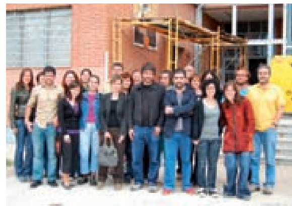
GRUPO TÉCNICO DE TRABAJO DEL PROGRAMA ROMA/ GITANOS DEL ESTE EN LA SEDE DE LA FSG EN MADRID.