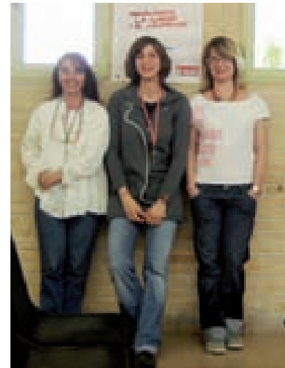
EQUIPO PROFESIONAL DE INTERVENCIÓN EN CENTROS PENITENCIARIOS.

Dentro del ámbito sanitario se pone en marcha un programa destinado a la prevención de infección por VIH en minoría étnica gitana en centros penitenciarios con el que se busca favorecer el acceso a la información y la puesta en marcha de comportamientos preventivos frente al VIH/sida.