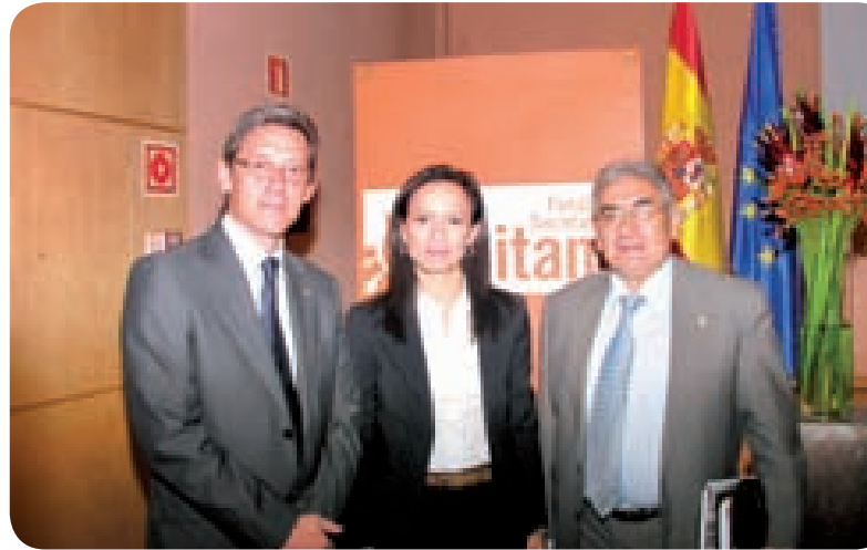
EL PRESIDENTE DE LA FSG JUNTO A LA MINISTRA DE VIVIENDA EN LA PRESENTACIÓN DEL "MAPA SOBRE VIVIENDA Y COMUNIDAD GITANA EN ESPAÑA, 2007"

1 Presentación del Mapa sobre vivienda y comunidad gitana en España, 2007 . Este trabajo ya comenzado en años anteriores se enmarca en los convenios de colaboración que la FSG suscribió con el Ministerio de Vivienda durante los años 2006 y 2007. Un trabajo muy exhaustivo, y que gracias a la labor realizada por una extensa red de informantes se ha obtenido información que, entre otros aspectos, ha posibilitado efectuar una estimación relativa al número de viviendas de la población gitana en España, conocer su ubicación y distribución en el territorio, y disponer de información respecto a las principales características del hábitat y de la propia población de etnia gitana. El alcance final de la información nos permite dar cuenta de 92.700 viviendas ubicadas en 2.955 barrios de 1.150 municipios españoles. A grandes rasgos, algunos de los principales resultados obtenidos son los siguientes: