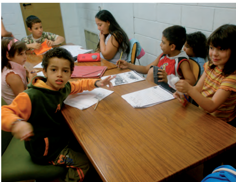
ACTIVIDADES DE APOYO ESCOLAR EN CENTROS EDUCATIVOS. DE NAVARRA