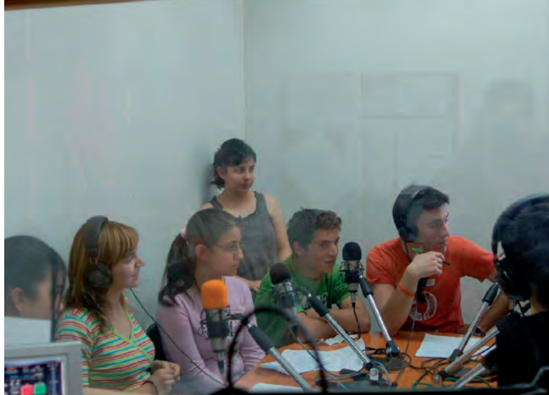
ACTIVIDADES EXTRAESCOLARES. EN SALAMANCA

Por otro, en lo que respecta al nivel de estudios alcanzado por las personas adultas gitanas, se observa que siete de cada diez personas gitanas mayores de 15 años son analfabetas absolutas o funcionales 2 , lo que indica que un valor 4,6 veces superior al que suponen los analfabetos entre la población española censada por el INE en 2001. Si consideramos solamente a los analfabetos absolutos vemos que la proporción se eleva aun más, entre la población gitana suponen 5,2 veces más que en el