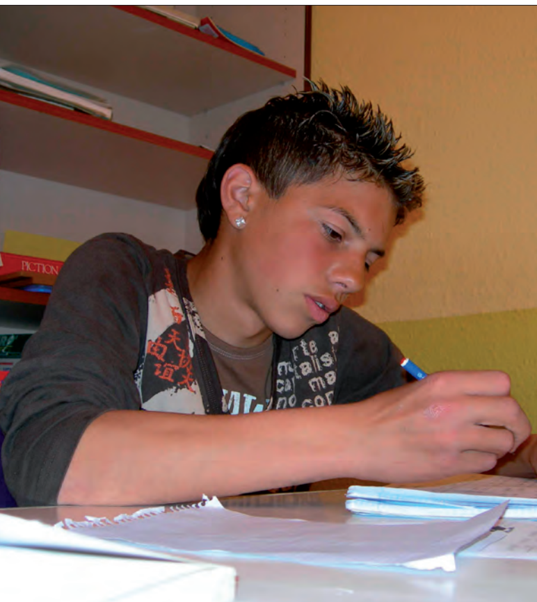
ACCIONES DE TUTORÍAS EN NAVARRA.