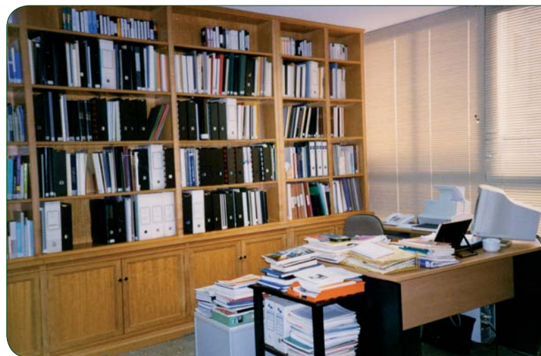
CENTRO DE DOCUMENTACIÓN DE LA FSG