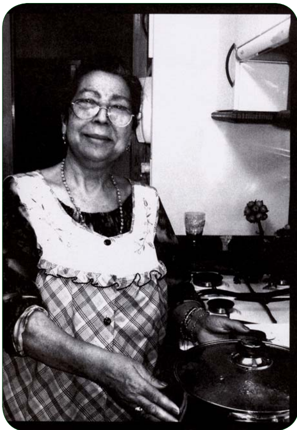
RECETAS GITANAS. PUCHEROS PARA COMPARTIR

Para la elaboración y participación en muchas de estas actividades se ha contado con los recursos y servicios del Centro