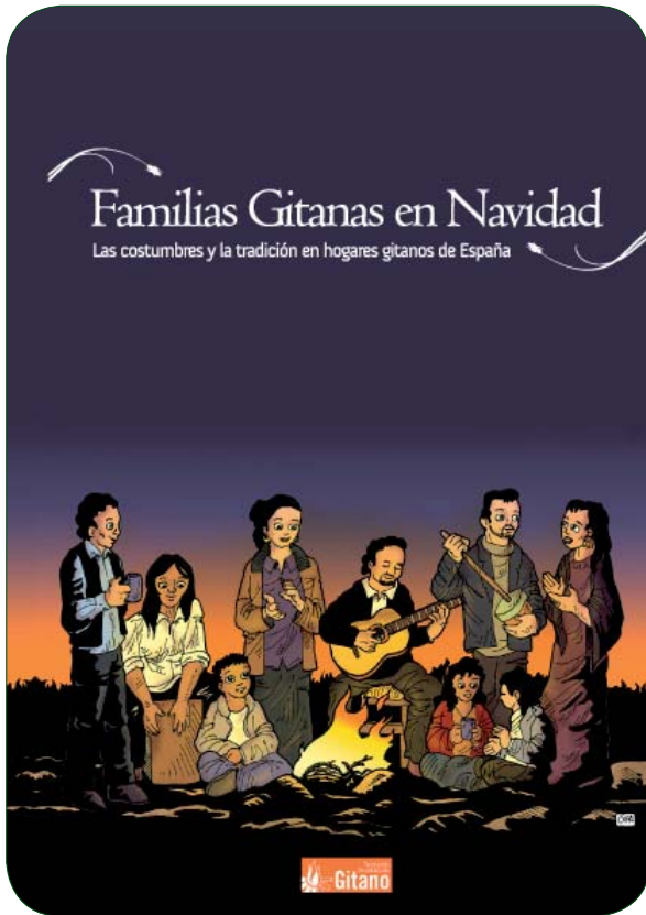
LIBRO FAMILIAS GITANAS EN NAVIDAD

la geografía española, sumando unas 115 actuaciones .