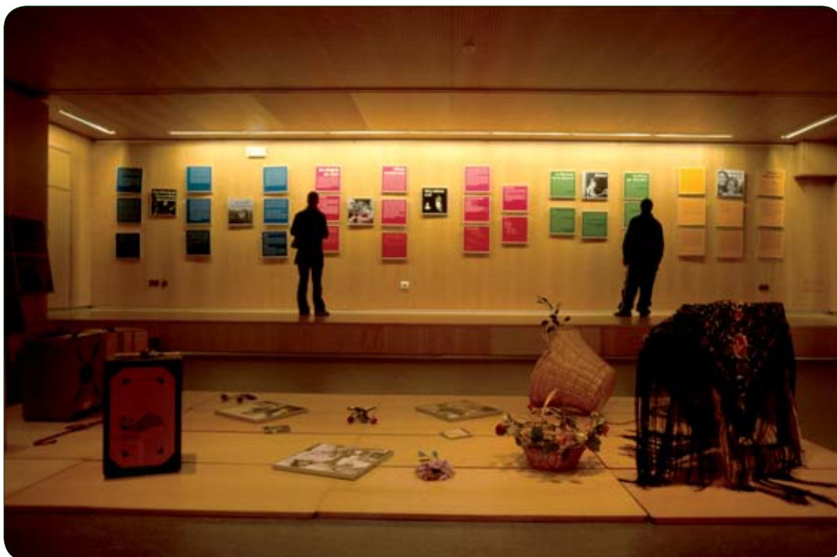
EXPOSICIÓN CULTURAS PARA COMPARTIR. GITANOS HOY

En la Europa ampliada, la comunidad gitana representa un grupo de población muy relevante, en torno a 10 millones de personas. Los gitanos son una de las minorías europeas en las que un porcentaje significativo de sus miembros continúan sumidos en una situación de exclusión social, sometidos a procesos de discriminación que limitan el ejercicio de sus derechos y el acceso a los recursos y servicios, entre ellos los culturales, de los que disfrutan el resto de los/as ciudadanos/as de Europa.