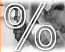
Tabla 4.1. Tipología ocupacional de la población activa en %