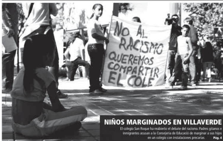
NIÑOS MARGINADOS EN VILLAVERDE El colegio San Roque ha reabierto el debate del racismo. Padres gitanos e inmigrantes acusan a la Consejería de Educación de marginar a sus hijos en un colegio con instalaciones precarias Pág. 4