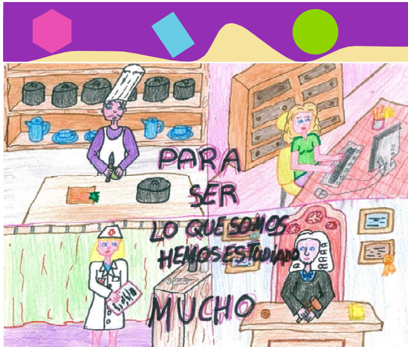
Cayetano Salazar Salazar