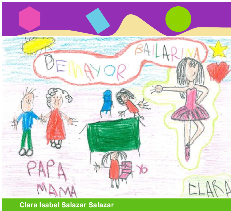
Clara Isabel Salazar Salazar