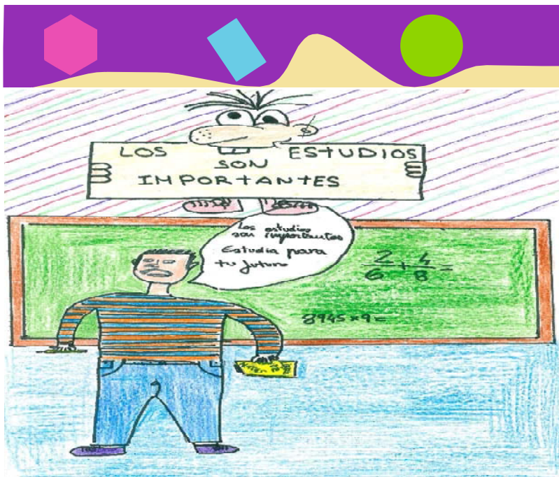
Ramón Salazar Salazar