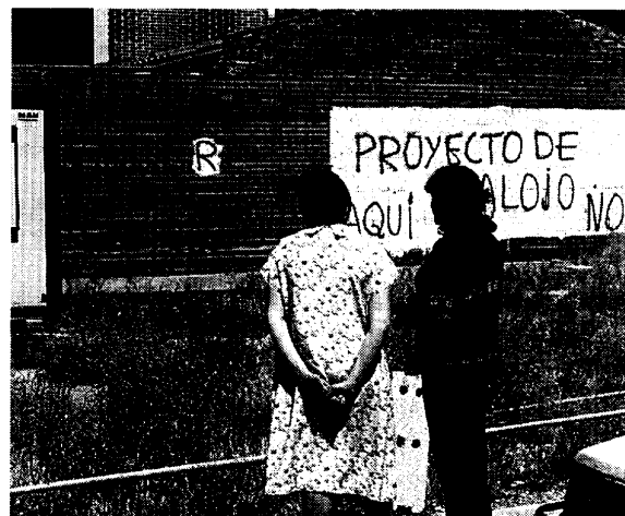
Pintada contra el realojo en el solar de la plaza de Las Nieves.