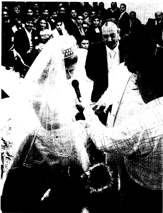
UNIÓN. Los novios se dan el sí, quiero. / CASIMIRO MORENO