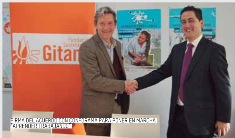
FIRMA DEL ACUERDO CON CONFORAMA PARA PONER EN MARCHA "APRENDER TRABAJANDO"