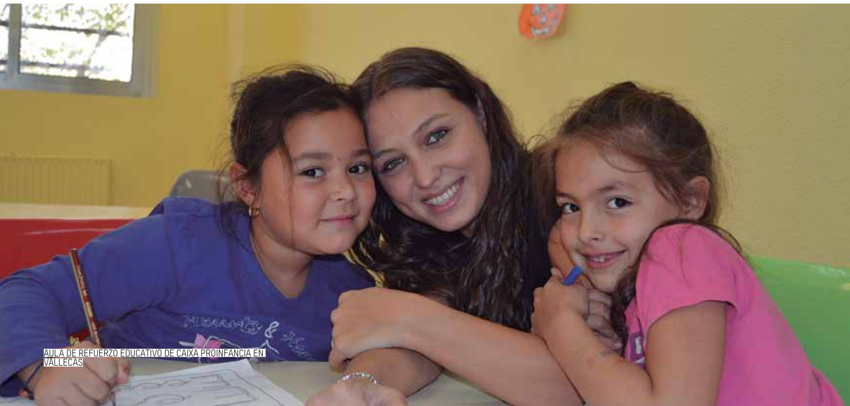
AULA DE REFUERZO EDUCATIVO DE CAIXA PROINFANCIA EN VALLECAS

PESE A LA CRISIS, NUESTRO PROGRAMA DE FORMACIÓN Y EMPLEO ACCEDER HA MEJORADO SU RESULTADO CONSIGUIENDO 222 CONTRATOS DE TRABAJO, 52 MÁS QUE EN EL 2012