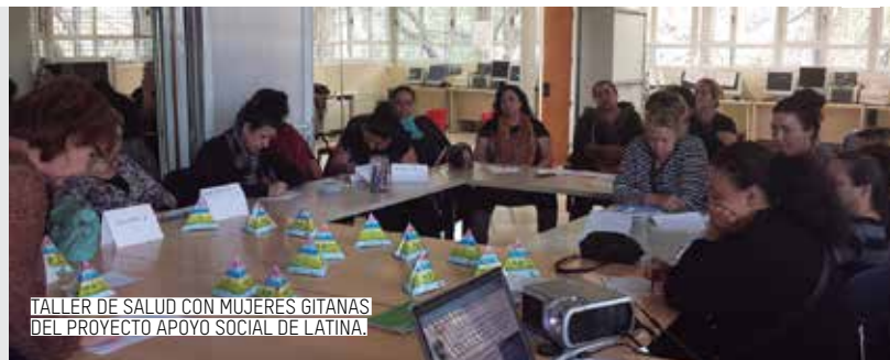
TALLER DE SALUD CON MUJERES GITANAS DEL PROYECTO APOYO SOCIAL DE LATINA.

Actualmente, la mayoría de las personas gitanas de nuestra comunidad está por debajo de los niveles de vida medios del resto de la población madrileña, lo que les impide salir de su situación de exclusión.