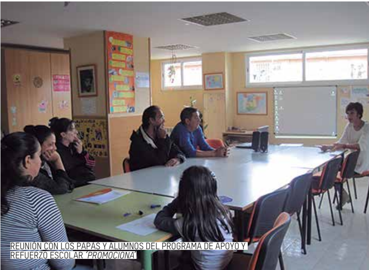
REUNIÓN CON LOS PAPAS Y ALUMNOS DEL PROGRAMA DE APOYO Y REFUERZO ESCOLAR 'PROMOCIONA'