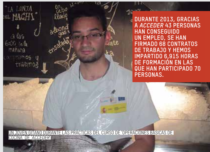
UN JOVEN GITANO DURANTE LAS PRÁCTICAS DEL CURSO DE 'OPERACIONES BÁSICAS DE COCINA' DE 'ACCEDER'

DURANTE 2013, GRACIAS A ACCEDER 43 PERSONAS HAN CONSEGUIDO UN EMPLEO, SE HAN FIRMADO 68 CONTRATOS DE TRABAJO Y HEMOS IMPARTIDO 6.915 HORAS DE FORMACIÓN EN LAS QUE HAN PARTICIPADO 70 PERSONAS.