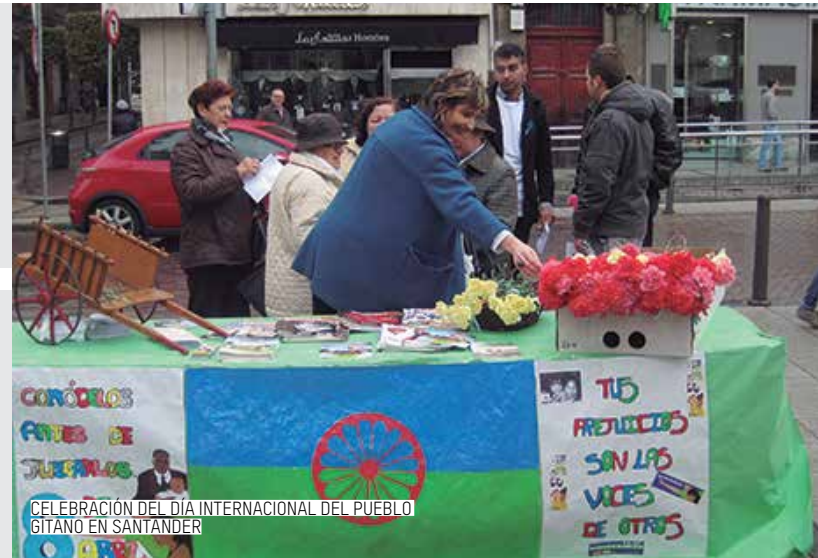
CELEBRACIÓN DEL DÍA INTERNACIONAL DEL PUEBLO GITANO EN SANTANDER

PROGRAMA DE INTERMEDIACIÓN LABORAL. Intermediación del mercado laboral en colaboración con la Fundación Obra Social "la Caixa".