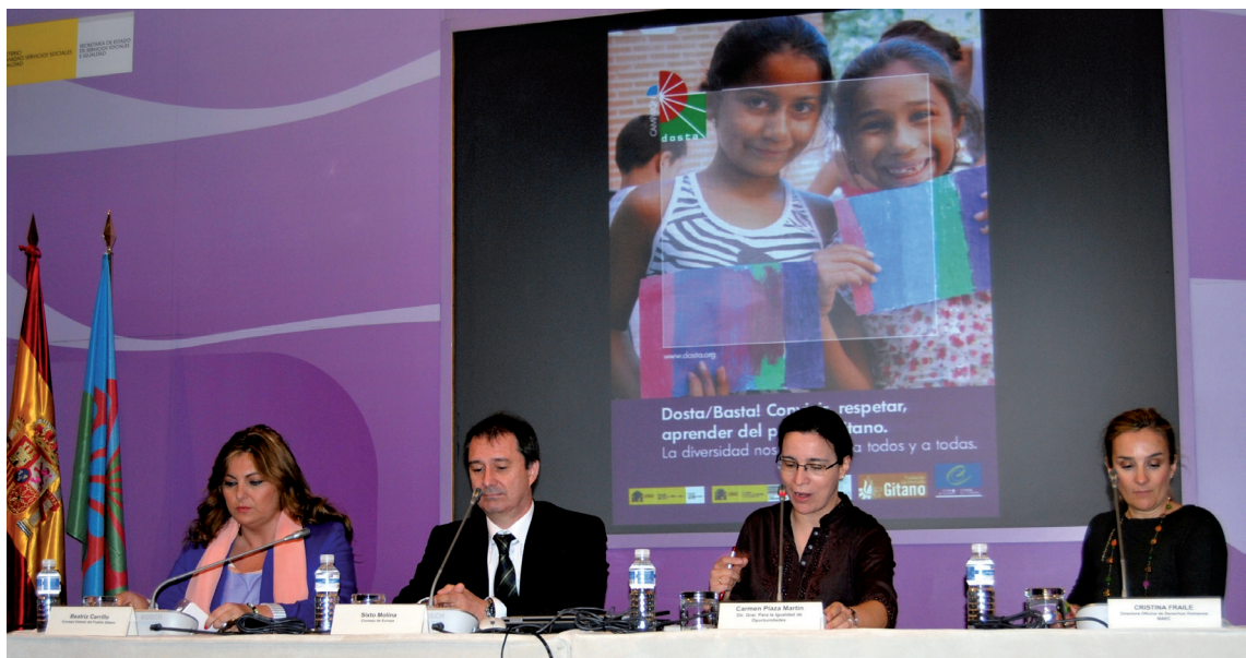
Acto de adhesión de España a la Campaña Dosta! 9 de abril de 2013.

En España desde el año 2013 la campaña está siendo promovida por el Ministerio de Sanidad, Servicios Sociales e Igualdad, el Ministerio de Asuntos Exteriores y Cooperación, el Consejo Estatal del Pueblo Gitano, y la Fundación Secretariado Gitano.